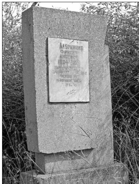
Могила Ф. Лабренциса на старом евпаторийском кладбище

Войдя в город, солдаты набрасывались на жителей, раздевали их и тут же, на улице напяливали на себя отянутую одежду, швыряя свою изодранную солдатскую несчастью... Кто только мог из жителей, попрятались по подвалам и укромным местам, боясь попадаться на глаза озверелым красноармейцам...» [11, с. 59–60].