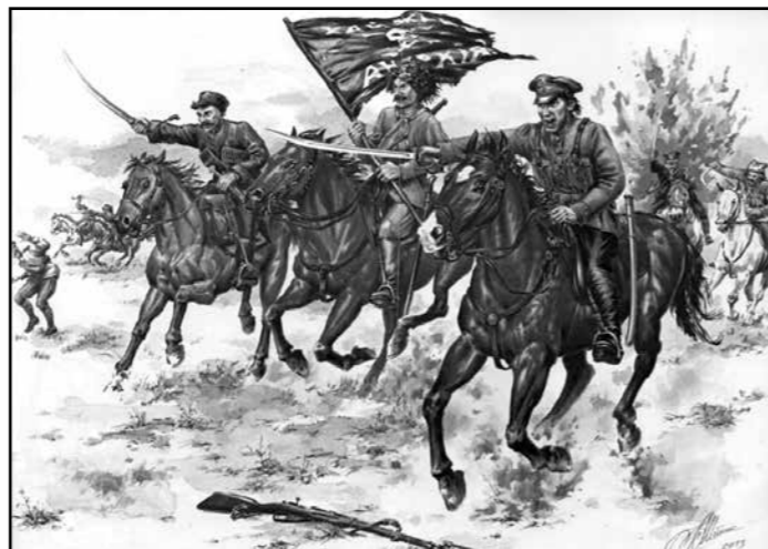
Махновская конница. Художник Тарас Штык

Далее в обращении указывается, что пойти на соглашение с большевиками махновцев вынуди-